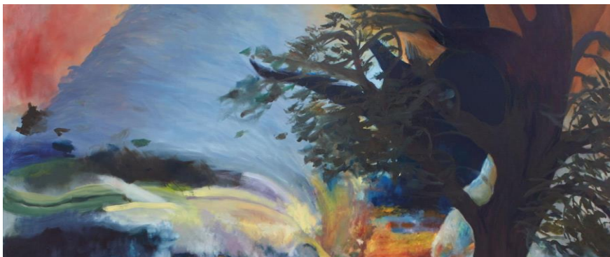
Fusing the formal and the informal